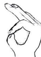
Колючко Указательный и большой пальцы соединяются. Средний, безымянный, мизинец вытянуты вперед.