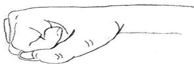
Ладонь, сжатая в кулак